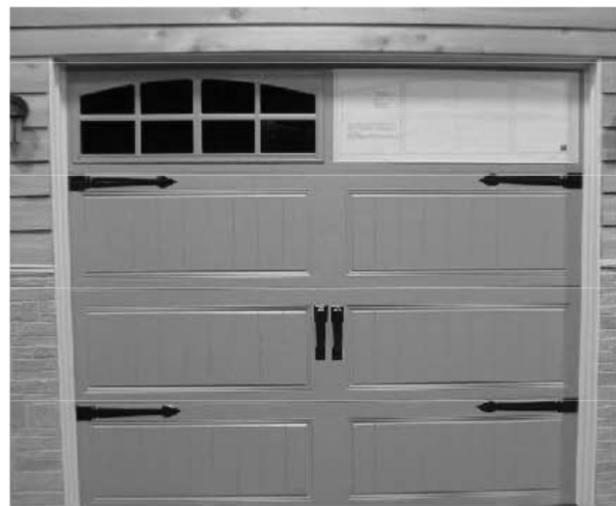
Figure 1 Figura 1